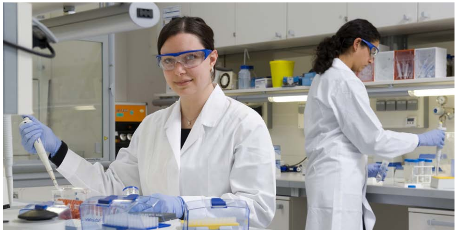
Gut ausgebildete Laboranten sind das Rückgrad leistungsfähiger Pharmedien

nur dann machen sich die Forschungsinvestitionen bezahlt. Gelungene Innovationen können in dieser Branche mit außergewöhnlich hohen Gewinnen belohnt werden. Aber auf dem Weg dorthin bestehen Risiken gewaltiger Fehlinvestitionen. Von jährlich 85 Milliarden Dollar, die die Pharmaindustrie weltweit in die Forschung investiert, sind rund 60 Milliarden „schlicht in den Sand gesetzt“, folgerte im April 2011 die Frankfurter Allgemeine Zeitung.