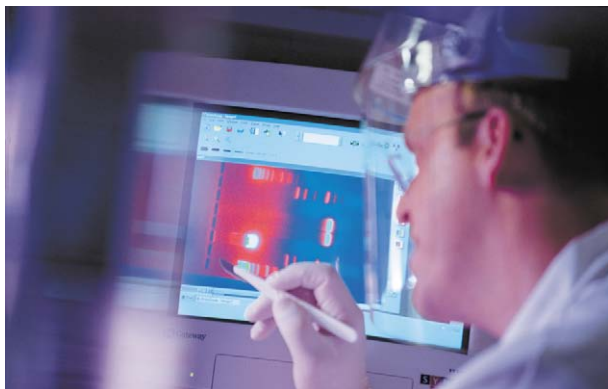
Hat die Substanz angeschlagen? Das Lesegerät zeigt es.

Anders als in anderen Branchen aber hängt selbst bei mächtigen Großunternehmen der Pharmaindustrie Wohl oder Wehe von Arbeitsplätzen und Eigentümern von einer kleinen Gruppe durchschlagender Produktinnovationen ab. Aus den Forschungsprozessen müssen zumindest alle paar Jahre zwei oder drei Medikamente mit echtem therapeutischen Fortschritt für eine Vielzahl von Menschen hervorgehen. Denn nur dann wird die Innovation von Ärzten und Patienten angenommen, nur dann wird aus einem Medikament ein „Blockbuster“, wie gelungene Markteinführungen in der Branche heißen. Und